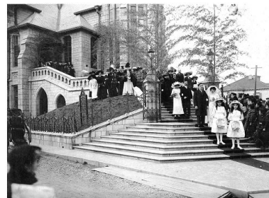
▲ 画像をクリックで詳細ページへ