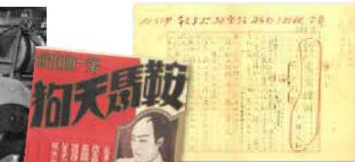
大佛次郎「鞍馬天狗 新東京絵図」原稿 1947年